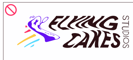
aplicar efeitos de distorção