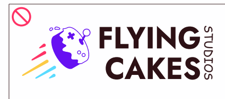
trocar as fontes