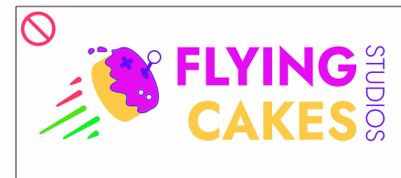
alterar as cores