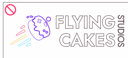
usar em outline