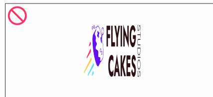
redimensionar sem proporção

O uso indevido do logotipo corre o risco de causar um impacto negativo à marca, por isso é muito importante se atentar não apenas à como o logo deve ser aplicado, mas também a como NÃO deve.